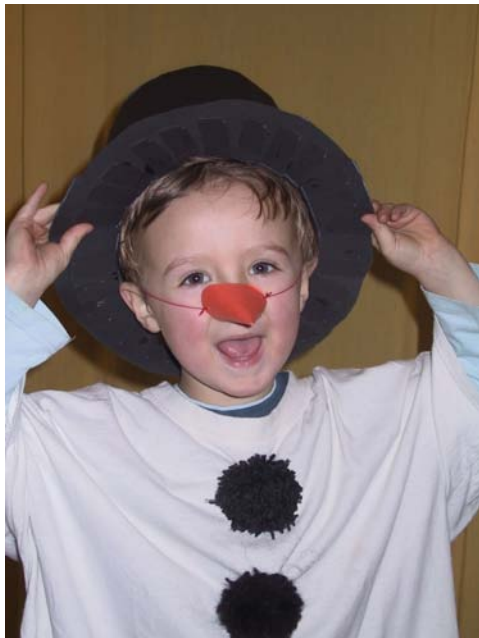
„Ich bin ein kleiner Schneemann ...“